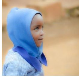
School Body of Christ