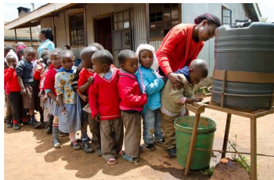
Foto: Structuur en hygiëne op school. Goede ontwikkelingen.

De 450 knapzakken hebben we in Limuru gevuld met een bord, beker en een lepel. Daar waren ze erg blij mee. De meeste mensen hebben niet eens bestek om mee te eten.