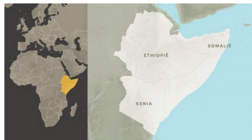
Foto: Het oosten van Afrika lijdt onder de droogte

Volgens het Rode Kruis is de nood hoog en is het in jaren niet zo droog geweest. Ook in november en december (de periode waarin normaal de regen valt) bleef het grotendeels droog. Normaal gesproken kunnen mensen tijdens het regenseizoen water verzamelen om gewassen mee te groeien en dieren te laten drinken. Maar door de aanhoudende droogte is er nu nauwelijks voedsel beschikbaar.